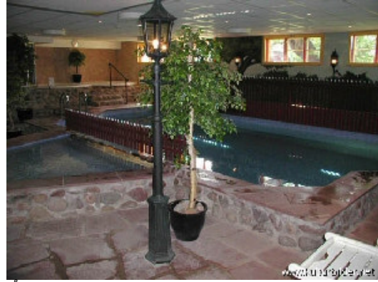
Åkerblads, Tällberg. Bada i samma vatten som bl a Kofi Annan?

Förhållandet mellan NLD och utvecklingsstörning kommenteras.