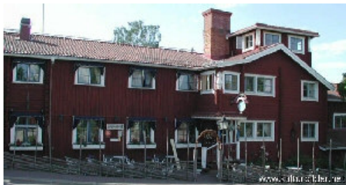
Åkerblads, Tällberg, platsen för höstkonferensen